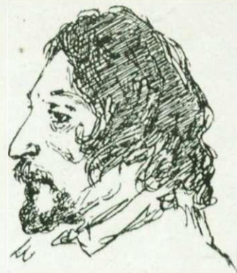
Н. В. Гоголь. Автопортретъ.